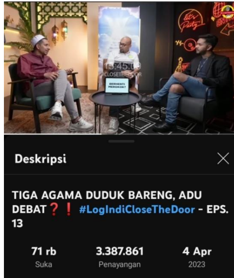
Gambar 1. Konten #LogIndiCloseTheDoor “Tiga Agama Duduk Bareng, Adu Debat ? ! Eps. 13” kanal youtube Deddy Corbuzier

Dalam konten #LogIndiCloseTheDoor di atas proses konstruksi moderasi beragama tak hanya ditampilkan lewat tanda atau simbol saja namun juga lewat framing teks, dialog, tokoh di dalamnya, dan juga reaksi penonton lewat interaksi yang ada di kolom komentar. Penggunaan kata – kata seperti toleransi, bareng, bersama, sudut pandang, kemanusiaan, Indonesia, agama penuh cinta dan kebaikan yang disematkan pada judul video, deskripsi konten maupun dialog yang berulang – ulang diucapkan merupakan framing dalam mengkonstruksi atau menggiring makna hidup beragama yang harmonis dan humanis kepada penontonnya. Menurut (Suci dan Mohammad 2022) wacana yang selalu dikonstruksikan atau disajikan akan membuat sebuah kelumrahan atau kebenaran kolektif. Hal itu karena teks dipengaruhi oleh konteks yang berkembang di masyarakat. Isu yang diangkat oleh konten tersebut bersifat universal dan nyata di kehidupan sehari – hari masyarakat Indonesia. Lalu penggunaan bahasa sehari – hari seperti “gua” “lu” dalam penyampaian wacana – wacana yang dibangun menyimbolkan tidak adanya ketegangan antara mereka dan juga memudahkan penontonnya untuk menyerap makna yang dibangun dengan mudah dan cepat, sehingga tidak heran jika konten #LogIndiCloseTheDoor ini menjadi konten paling menonjol dalam mengkampanyekan wacana moderasi beragama. Dapat dilihat dalam teks pada komentar podcast tersebut yang dipengaruhi oleh kognisi sosial para komentator.